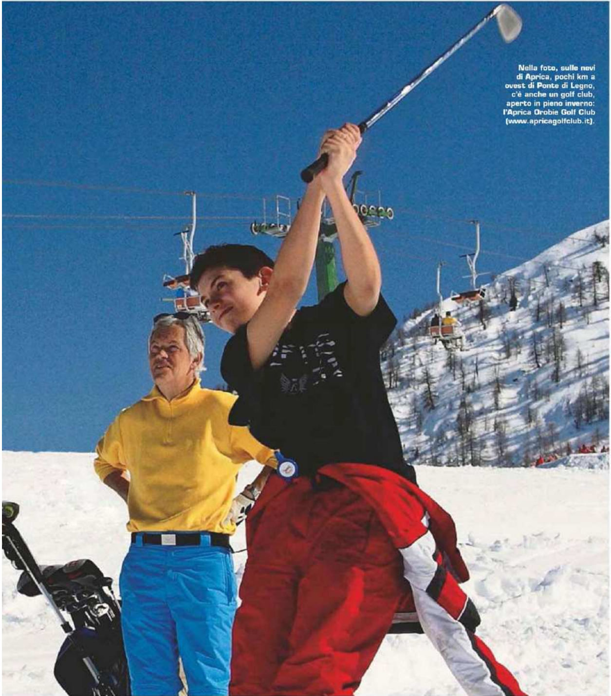
Nella foto, sulle nevi di Aprica, pochi km a ovest di Ponte di Legno, c'è anche un golf club, aperto in pieno inverno: l'Aprica Orobie Golf Club ( www.apricagolfclub.it ).